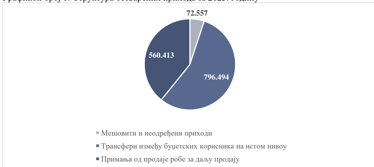
Графикон број 1: Структура остварених прихода за 2023. годину

У поступку ревизије извршено је тестирање у вези са свим релевантним тврдњама руководства исказаним у ревидираним финансијским извештајима у вези са текућим приходима.